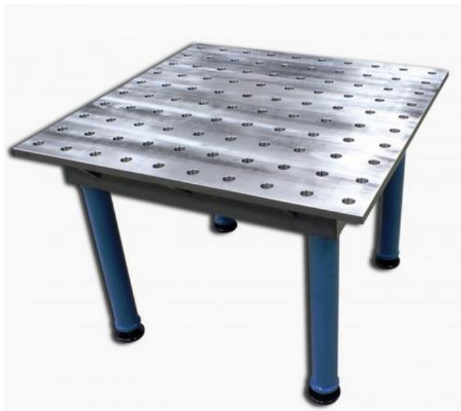
Table de soudure WJT-3939 BAILEIGH INDUSTRIAL

Valable jusqu'au 31/12/2024 dans la limite des stocks disponibles